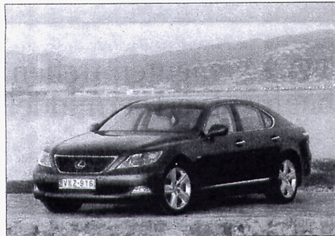
De LS 460 is een auto voor welstandige vijftigers.